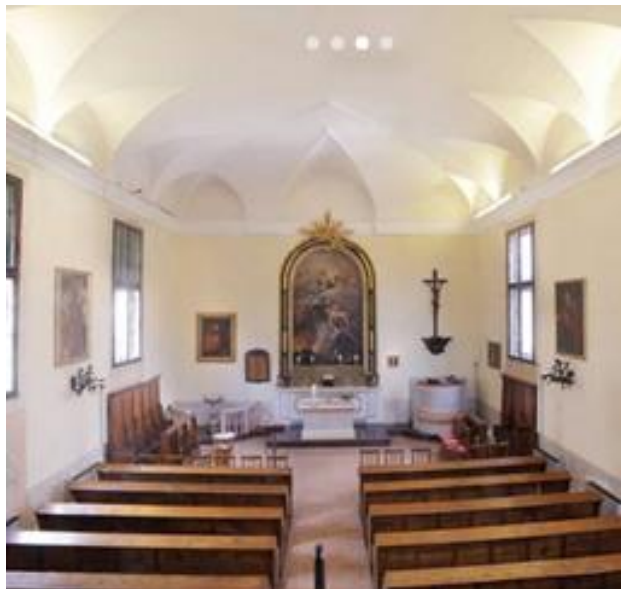
Chiesa Evangelica – Luterana Venezia